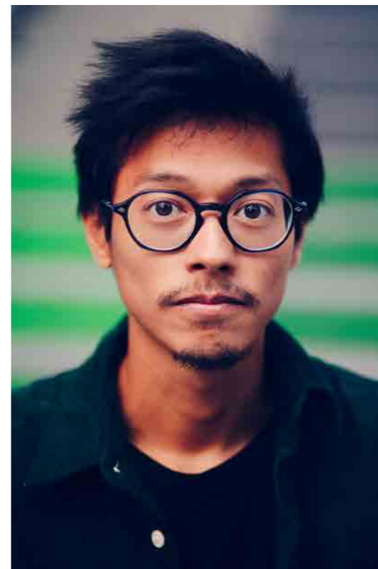
REUTTY SOK (il) Éditeur